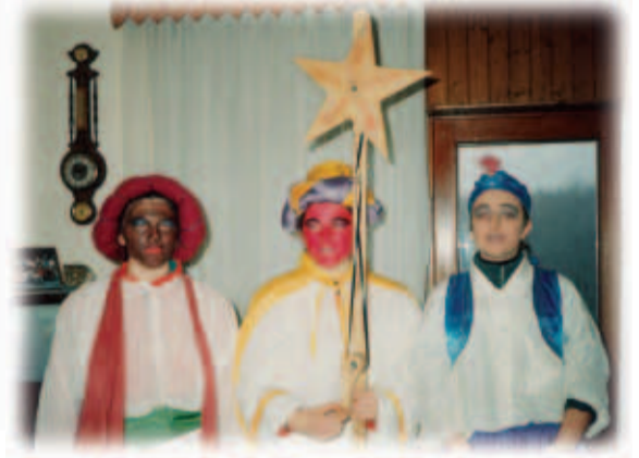
Ckiniga van 1994 (gapoarn is 1975)