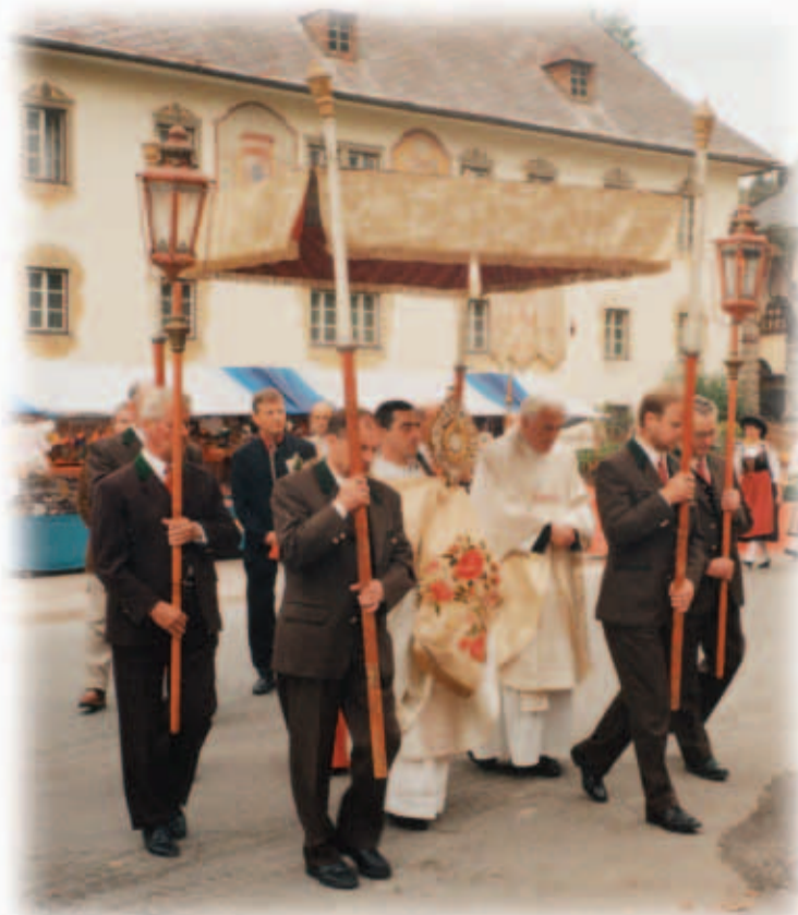
Unsadar Gaistligar in Roasnchronztog van 1999

Memar a mool dortan iis, um naina beart da meis gamocht af taic unt balisch, zungan van unsarn koro. Verti da meis, dar Pforar min Sein, da mandar, da baibar, da jungan min zandlan voula zoig asa van velt auf hont gannoman unt ola da lait hintnnooch geant in umagon pis voar a maina, noor bidar hintar in da chircha. Men da meis verti is, in lait beart geim a cipali gabicknans zoig asmar hamm trok unt aufhenk in da haisar.