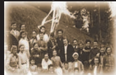
In Schenscha tog