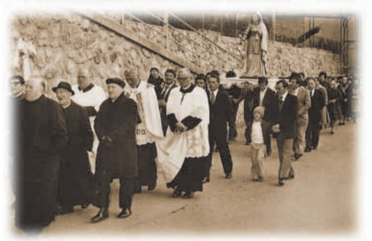
Geat abeck da fiakkola. Nochmitoog min chraiz avn vraitouf