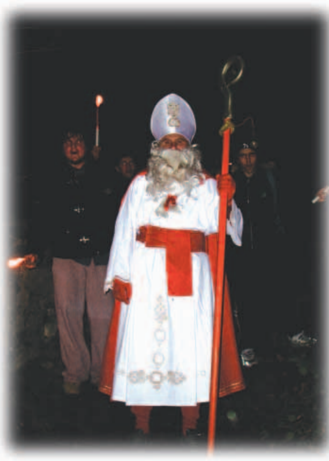
Chimp dar Hailiga Nikolò vir da vraid a van chindar

Herumpn, avn plozz var chircha, chindar unt groasa tuant umar hupfn abia da haslan, mensin hearnt schraian va baitnst: „Nikolaus, Nikolaus!!!“ da groasa vraid a mochza niamar in da haut plaim. Nooch an bailalan, dar guata Haillat geat oar schian lonzn ibara schtreta van Fatt, noor oachn pis in sool van cinema, sizztar nidar unt dareimst asar rostat riaftar zuachn chint vir chint unt gippin sai packl. Verti ols aus zan geim, dar Nikolò griast ola, nemp hear sain schtoob unt geat baitar in ondara dearfar. Anias joar dar Cirkul Kultural richtatin a chastl bodar ainziacht gelt virn schpitol van chindar va Triascht.