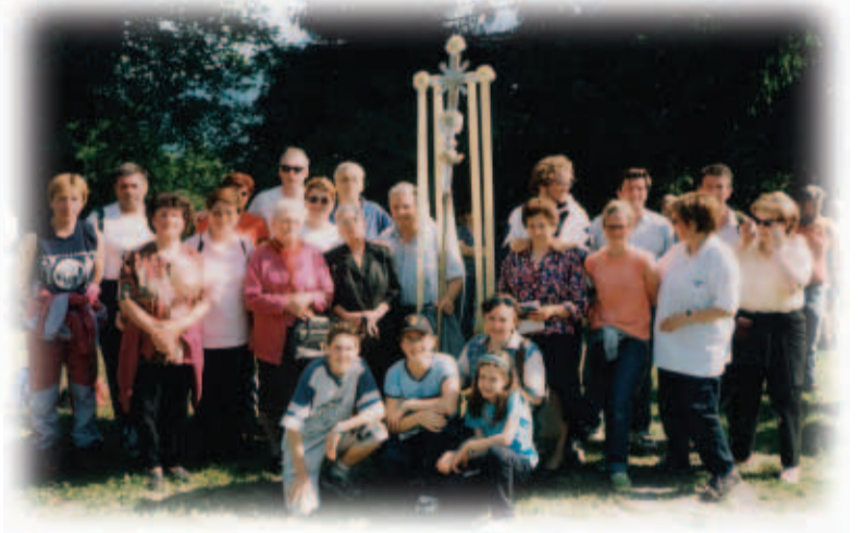
Af San Peatar is 2000