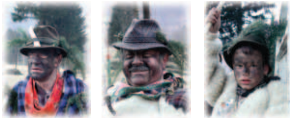
Vosching af Tischlbong. Maschkaras min kloukn, jutalan, zigainara, pleichmusik ...