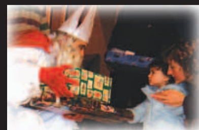
Dar Hailiga Nikolò