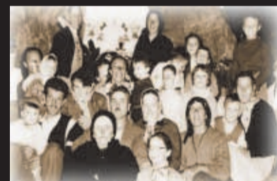
Da Muatargotis van chlopf