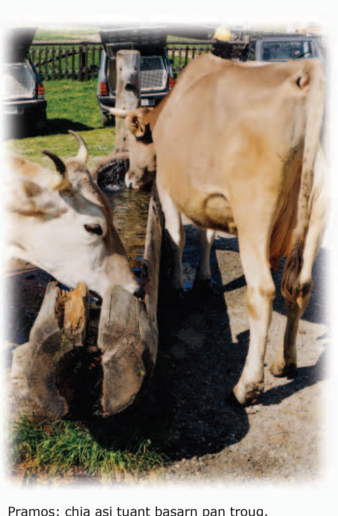
Pramos: chia asi tuant basarn pan troug.

Dar leista cock chia as vir- paai is gongan zavuas afta beiga, is gabeisn dar see van Beneto mendar hott ogalmp da olba van Kalindlan. Seachn virpaai gianan da chia afta bei- ga, mensa aufn odar oar van alm sent gongan, is aa a schia prauch gabei- sn, hearn laitn da kloukn asa uma hols hont ckoot, hearnsa lianan, seachnsa asou gamiatlich nooch gianan in hirtn, sent ola chlanickaitn gabeisn van totteglichn leim. Hiaz ols dosto sichtmar niamar unt afta beiga lai bartamool, mensa da chia aufn odar oar viarnt van Bisn, si- chtmar aneitlan vletn afta beiga.