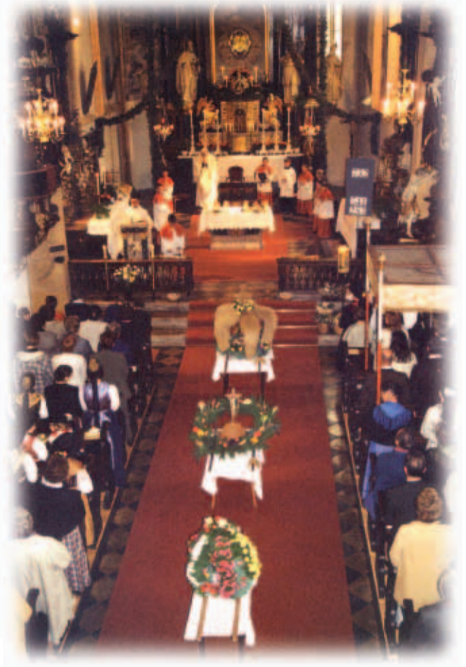
Da chrenzar min zoig van velt