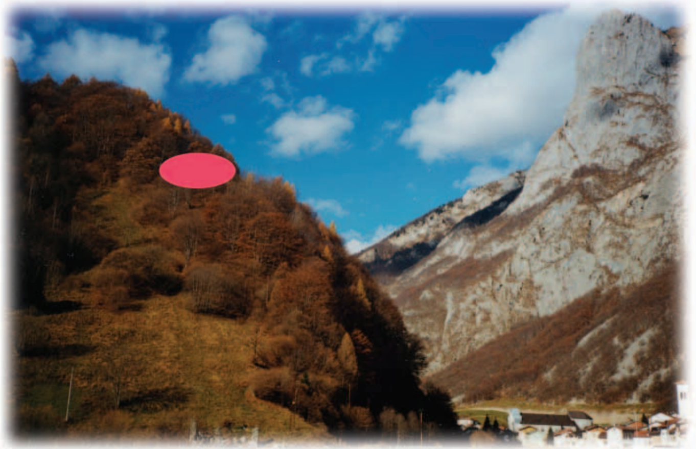
Is Satali bomar da schaiba odar schaima geat sghloon.

Da leista raas asmarsa hoom cloon is gabeisn is 1996 var laita var Ireen, untara Cupindias, darnooch, schult as niamar sghnaupt unt as ols dira iis, meikmar cka voiar on zintn unt chana schaiba sghloon asou niamp bast bearda is varliapt in doarf.