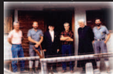
Da alm baichn