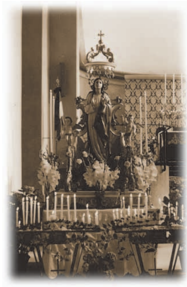
Da Muatargotis as in umagon beart gatroon

Sent schiana lustiga taga, ola geimp soiarn hilf as ols guat aus geat unt as a guatar gadonckn plaip van anondarn ibarleiptn Vrau too.