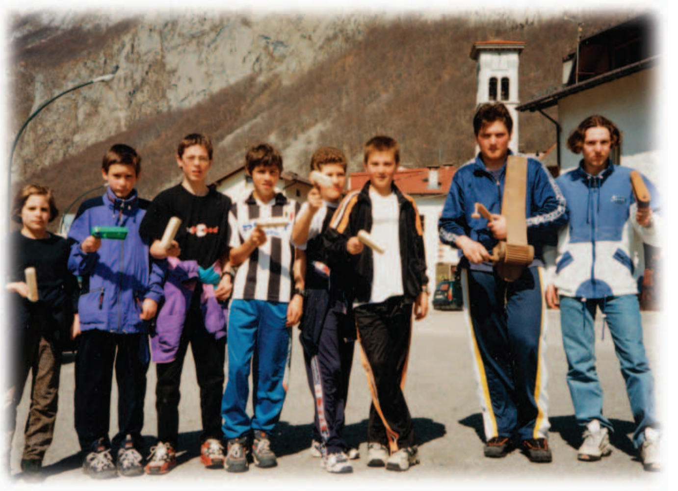
Chindar unt junga min krasghulas zan Oastarn van 1999.

Bearda a chint taftt cbint noch d'Oastarn unt prau-cht is see bosar, is dar prauch zan geim in Gai-stli-gar a chizzl.