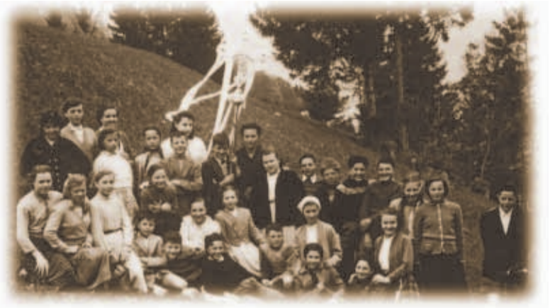
Af San Peatar is 1956