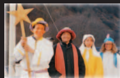
Da drai ckiniga