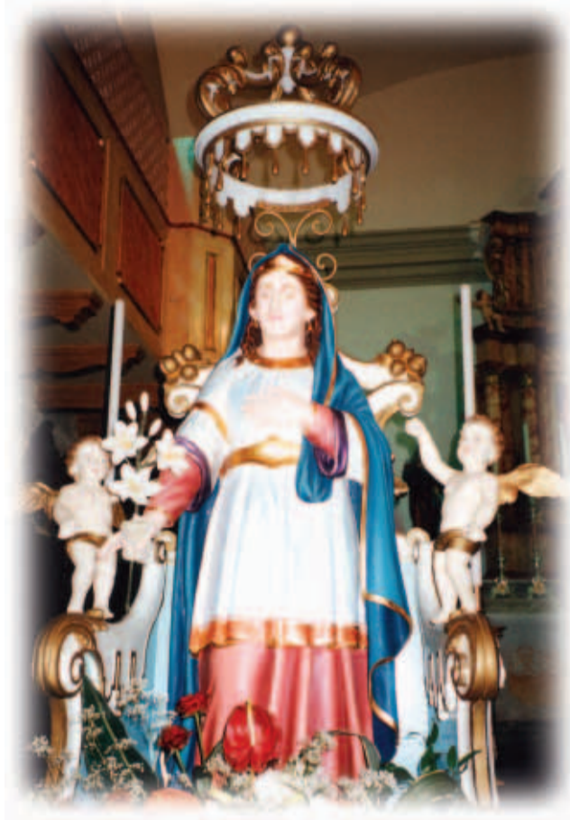
Unsara Hailiga Gertrude

In novembar van 2002 sent pfertigat da oarbatn as hear hont pfrischt da gonza olta chircha unt mit schtolz, miar tischlbongara, hom in sunti unsadar Hailiga Gertrude gamocht.