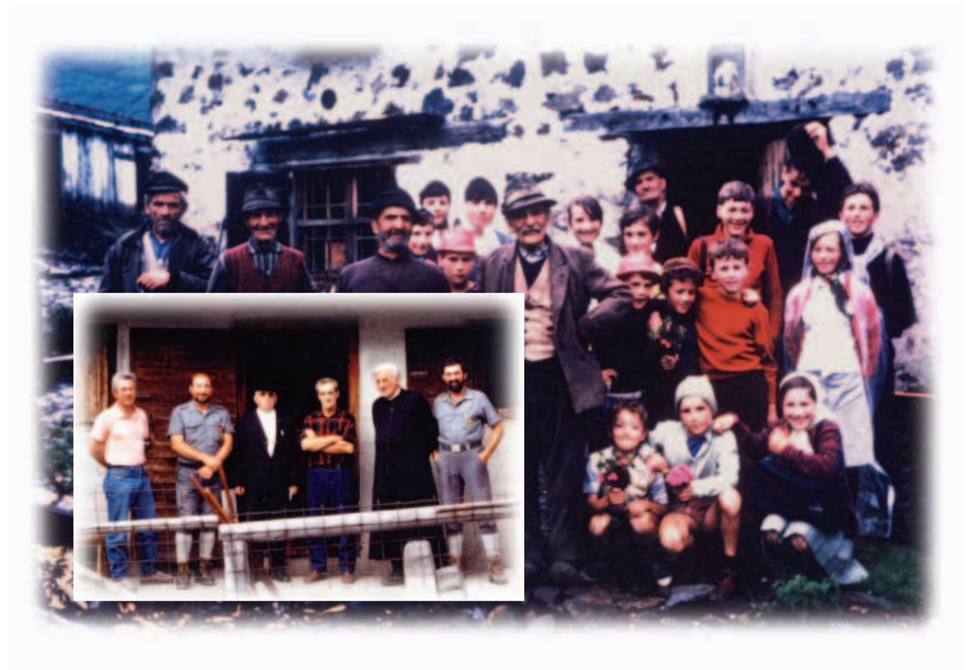
Da alm baichn in lui van 1967 (groasis pilt) unt in Lavareit in lui van 1994

Dear prauch is boarn paholtn pis voar a zbanzk joar, noor chindar sent obla bianigar gabeisn, dar Gaistligar is eltar boarn unt hontin da bolt bochtara pfiart baichn da alm mitt soiara kamioneta.