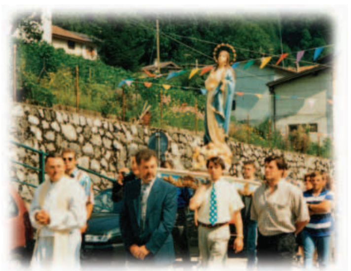
Umagon in Vrau tog van 1997