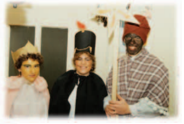
Ckiniga van 1986 (gapoarn is 1967)