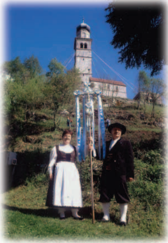
Da famea van Gigi van Tituta min chraiz var Hailiga Gertrude af San Peatar is 2002.

Nooch 135 joar a cock lait var Mauta chemant a hear zavuas virn Schenscha tog af H. Peatar mitt ola da ondarn chraizar, griasn unt pusn is chraiz var muatar chircha. Panuns da maistn geant oachn min maschindar ovar, da Velia van Ganz unt dar Sergio van Beec mocht da gonza raas zavuas abia dejoar. Cnochz, uma sezza, getmar par Soga ankeink in chraiz noor aufar ola zoma in da chircha vir da meis.