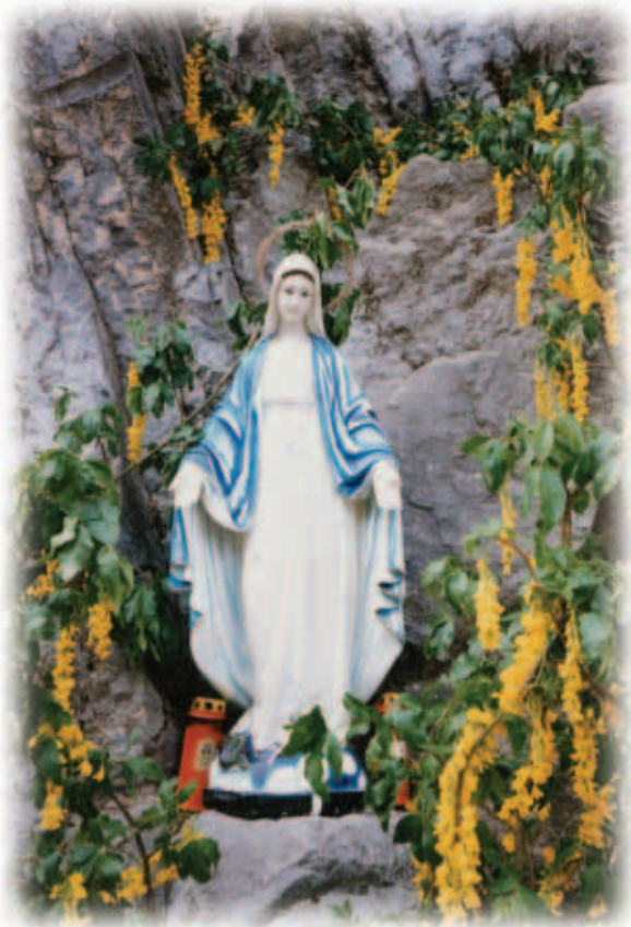
Da Muatargotis van Chlopf in Oubarlont

Hiaz avn chlopf beart aufn gatonan da Muatargotis var Luzzian van Bajok asuns dar Mauro var Faan obla gearn laicht.