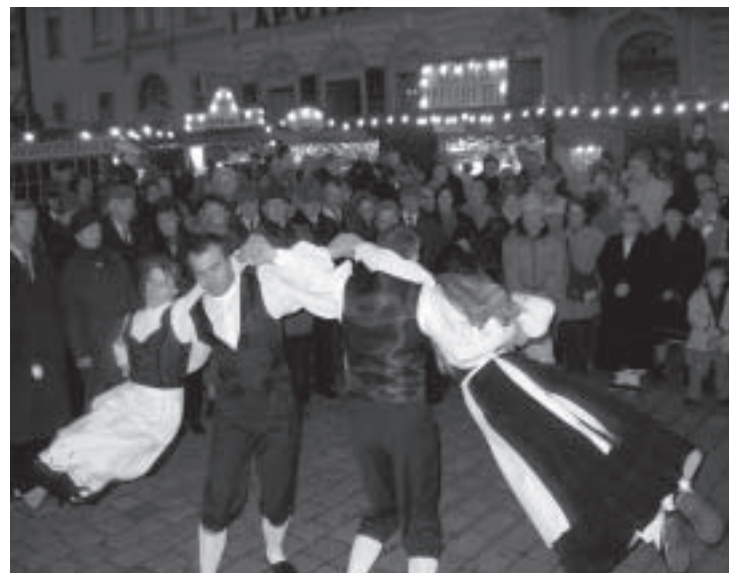
Da Jutalan a Vienna

Inge Geyer (traduzione dal tedesco di Francesca Cattarin)