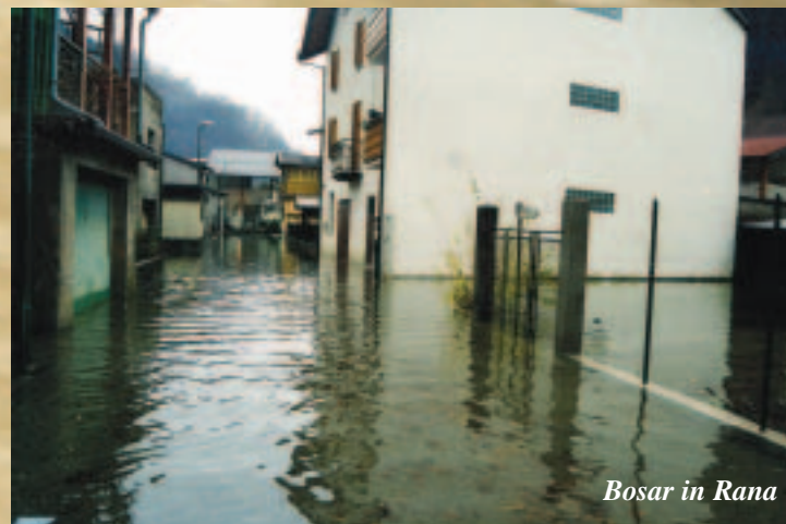
Bosar in Rana

sn, da seen var Protezion Civvil var Gamaan hontin cbint procht a sghlauch as is bosar hott gazouchn unt ausn cmisn van goartna. Kein da mitano-