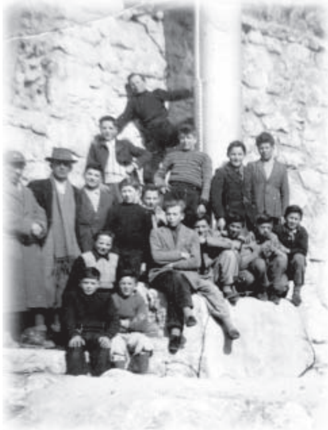
In da schual va diseng is 1953