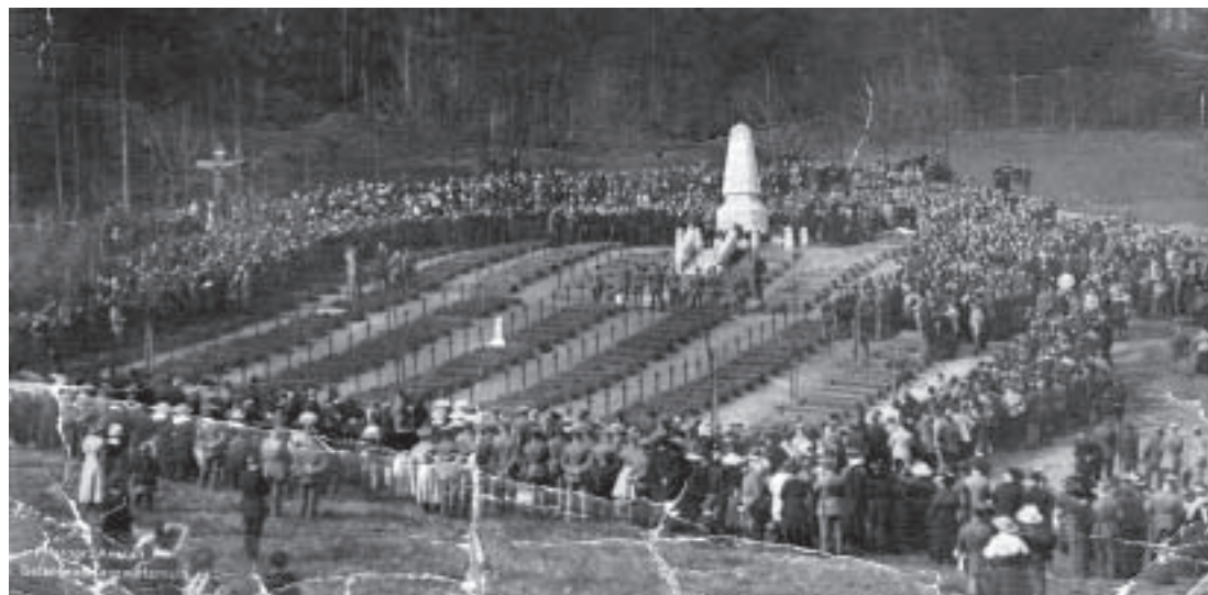
Ondenck van prisghoniirs van lager af Hamein