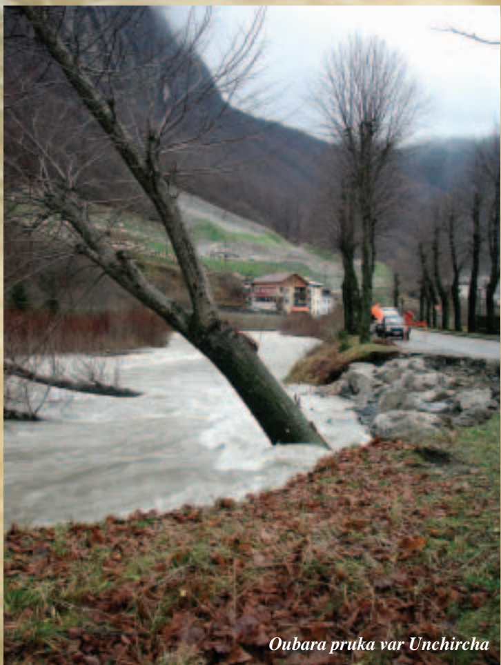
Oubara pruka var Unchircha